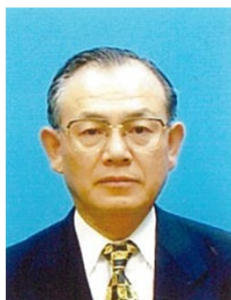
税理士法人 永田会計